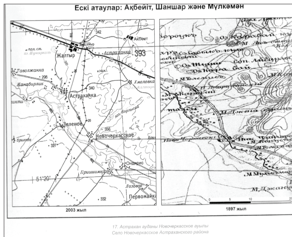
17. Астрахан ауданы Новочеркасское ауылы Село Новочеркасское Астраханского района

советской системы. В результате был нанесен огромный ущерб самобытности, национальной специфике казахской ономастики, особенно ее топонимической и антропонимической системе. Карта Казахстана была подвергнута значительным искажениям.