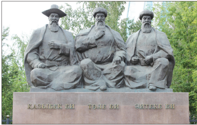
ҚАЗЫБЕК БИ ТӨМЕ БИ ӘЙТЕКЕ БИ

Сот төрелігін іске асыруда іс жүргізу құжаттарын жүргізетін, іске қатысушы адамдармен тікелей қарым қатнас жасайтын, судьяның күнделікті қызметін қамтамасыз