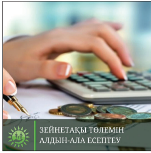
ЗЕЙНЕТАҚЫ ТӨЛЕМІН АЛДЫН-АЛА ЕСЕПТЕУ

Барлық сұрақтар бойынша әлеуметтік және зейнетақы мәселелері бойынша 1414 Бірыңғай байланыс орталығына хабарласуға болады.