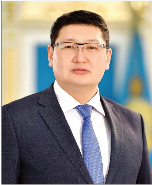
ПРЕЗИДЕНТТІҢ БАСПАСӨЗ ХАТШЫСЫ БЕРІК УӘЛИМЕН СҰХБАТ

Сонымен қатар дағдарысқа қарсы «Жұмыспен қамтудың Жол картасы» бағдарламасы іске қосылды. Оны жүзеге асыру үшін 1 триллион теңге бөлінді. Пандемияның ауыртпалығына қарамастан, өндіріс көлемі 1,5 есе, ауыл шаруашылығының өнімділігі 2,5 есе, экспорт 2 есе ұлғайды. Осы ретте арнайы тоқталып кететін бір мәселе ретінде IT және туризм салаларына тартылған ірі көлемдегі инвестицияны айта кету керек. Соның нәтижесінде 300 мың жаңа жұмыс орны