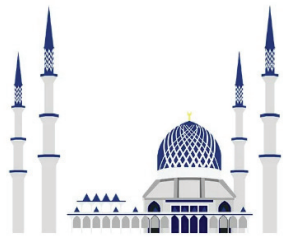
ҚҰРБАН АЙТ ҚАБЫЛ БОЛСЫН!

Құрбан айт күндері мұсылманның атқаратын ең жақсы ісі - құрбан шалу. Пенденің шалған құрбандығы Қиямет күні оның пайдасына күелік береді.