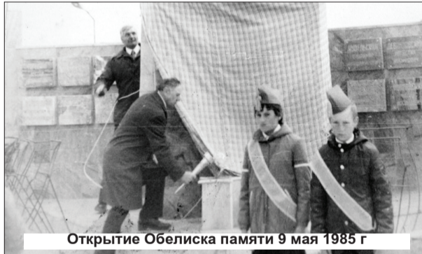
Открытие Обелиска памяти 9 мая 1985 г