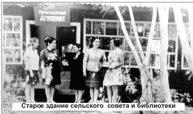
Старое здание сельского совета и библиотеки