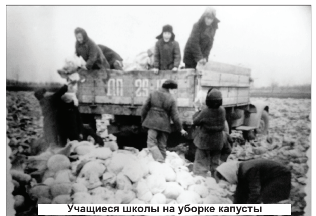
Учащиеся школы на уборке капусты