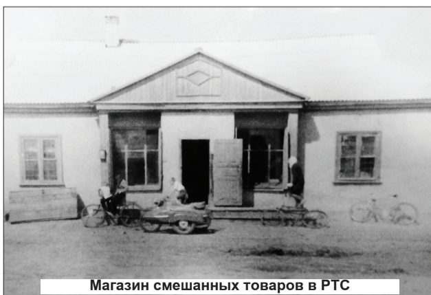
Магазин смешанных товаров в РТС