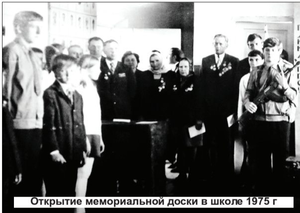
Открытие мемориальной доски в школе 1975 г