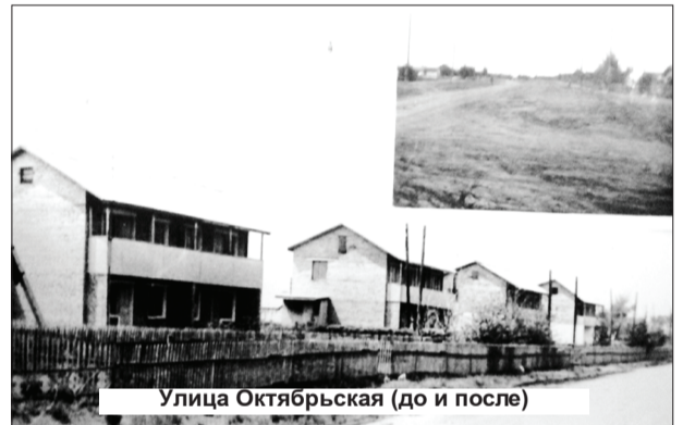
Улица Октябрьская (до и после)