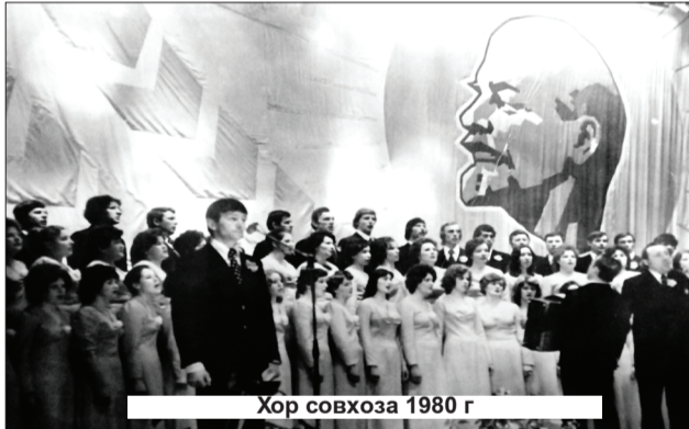
Хор совхоза 1980 г