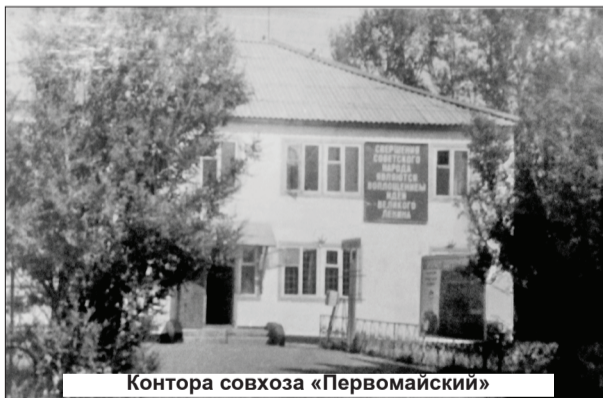
Контора совхоза «Первомайский»