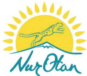
ГРАФИК ПРИЕМА ГРАЖДАН АСТРАХАНСКОГО ТЕРРИТОРИАЛЬНОГО ФИЛИАЛА ПАРТИИ «NUR OTAN» НА 6, 8, 9 СЕНТЯБРЯ 2021 г.

Көрсетілген байланыс телефондары бойынша қабылдауға алдын ала жазылуды сұраймыз call - орталық 8(71641)22278; 87085833901